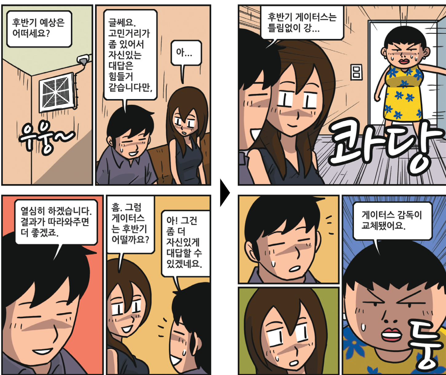
* '클로저 이상웅'은 'sportsdonga.com' 에서 첫 회부터 보실 수 있습니다.