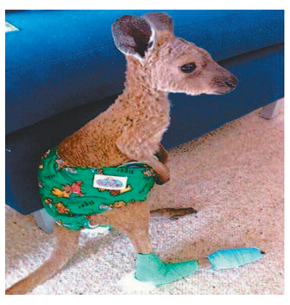
가족들이 모여 TV를 보고 있는데 초등생 막내가 한자를 배웠다며 '月火水木土日'을 자랑스러운 표정으로 읽어 내려갔다.

"월화수목금..." 그러자 중학생인 둘째 아들이 막내에게 핀잔을 준 다. "짜샤 그렇게 읽는 게 아니야, '월화수목금사'라고 읽어야지!" 그때 고등학생인 맏이가 나서 동생들에게 한마디 했다. "그것도 제대로 못 읽냐! '월화수목금토일'이지." 이때까지 가만히 듣고만 있던 아버지 말씀이 터기막하다. "애들이 누굴 닭아 이래? 왕편 가져와서 한번 찾아봐라. 왕편!" 저 또 왔슈! 공짜라면 죽고 못 사는 구두쇠 맹구. 몸이 아파도 돈이 아까워 버렸으나 이번엔 통증이 워낙 심한지라 병원을 찾은 수밖에 없었다. 병원 안내판에는 '초진: 5000원, 재진: 3000원.'이라 써있다. 3000원짜리 재진에서 눈을 떼지 못한 맹구, 고민하더니 마침내 진료실 문을 벌컥 열고 들어가서 하는 말. "선생님, 저 또 왔슈!"