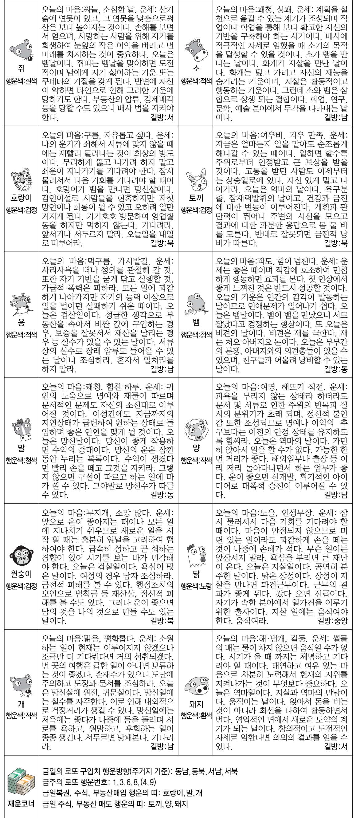
도원역리학회 도원학당 원장 *영어상당 가능(02-812-1201~2)