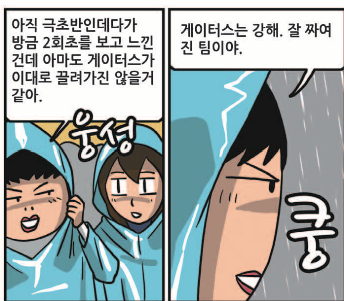
※ '클로저 이상웅'은 'sportsdonga.com' 에서 첫 회부터 보실 수 있습니다.