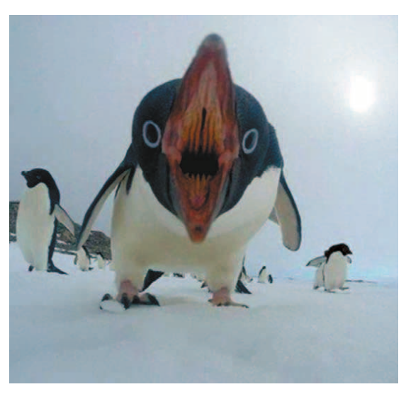
사진 찍지 말라구요!

을 찾아 물에 빠진 사람이 그쪽으로 떠내려 올 때까지 기다린다. ●의상학과 - 물 먹는 하마를 엄청나게 많이 강에 넣는다. ●교육학과 - 물에 빠진 사람에게 큰 소리로 수영하는 법을 가르쳐 준다.