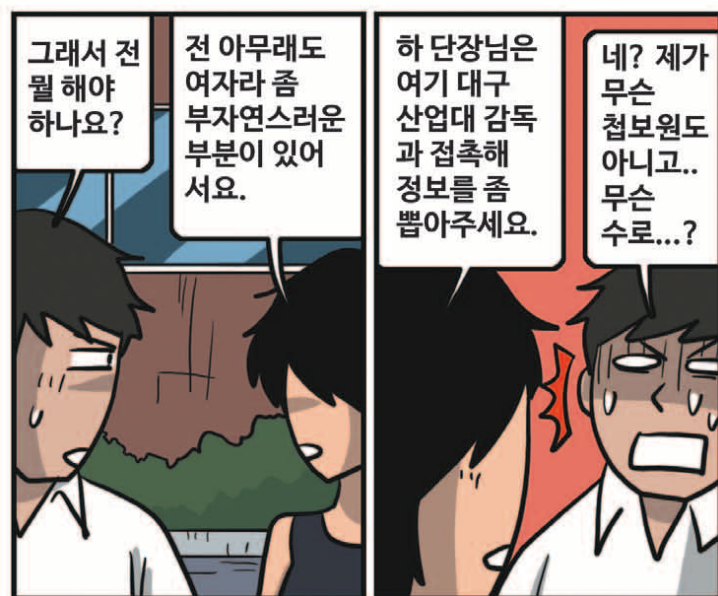
※ 'GM 드래프트의 날'은 'sportsdonga.com'에서 첫 회부터 보실 수 있습니다.