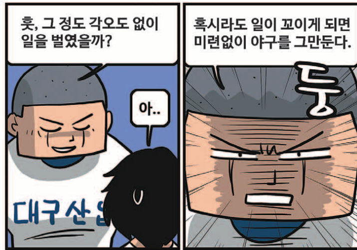
* 'GM 드래프트의 날'은 'sportsdonga.com' 에서 첫 회부터 보실 수 있습니다.