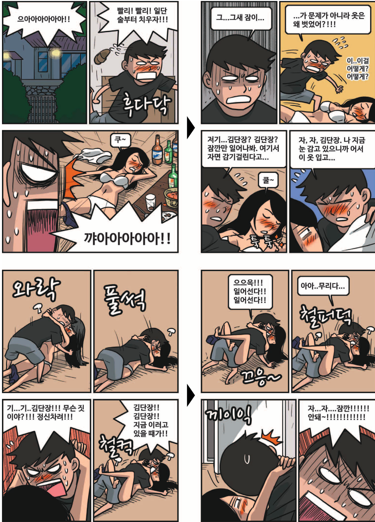
* 'GM 드래프트의 날'은 'sportsdonga.com' 에서 첫 회부터 보실 수 있습니다.