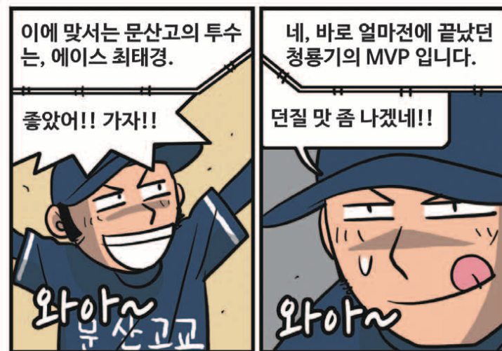
* 'GM 드래프트의 날'은 'sportsdonga.com'에서 첫 회부터 보실 수 있습니다.