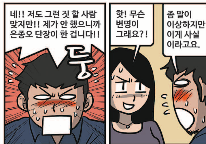
* 'GM 드래프트의 날'은 'sportsdonga.com'에서 첫 회부터 보실 수 있습니다.