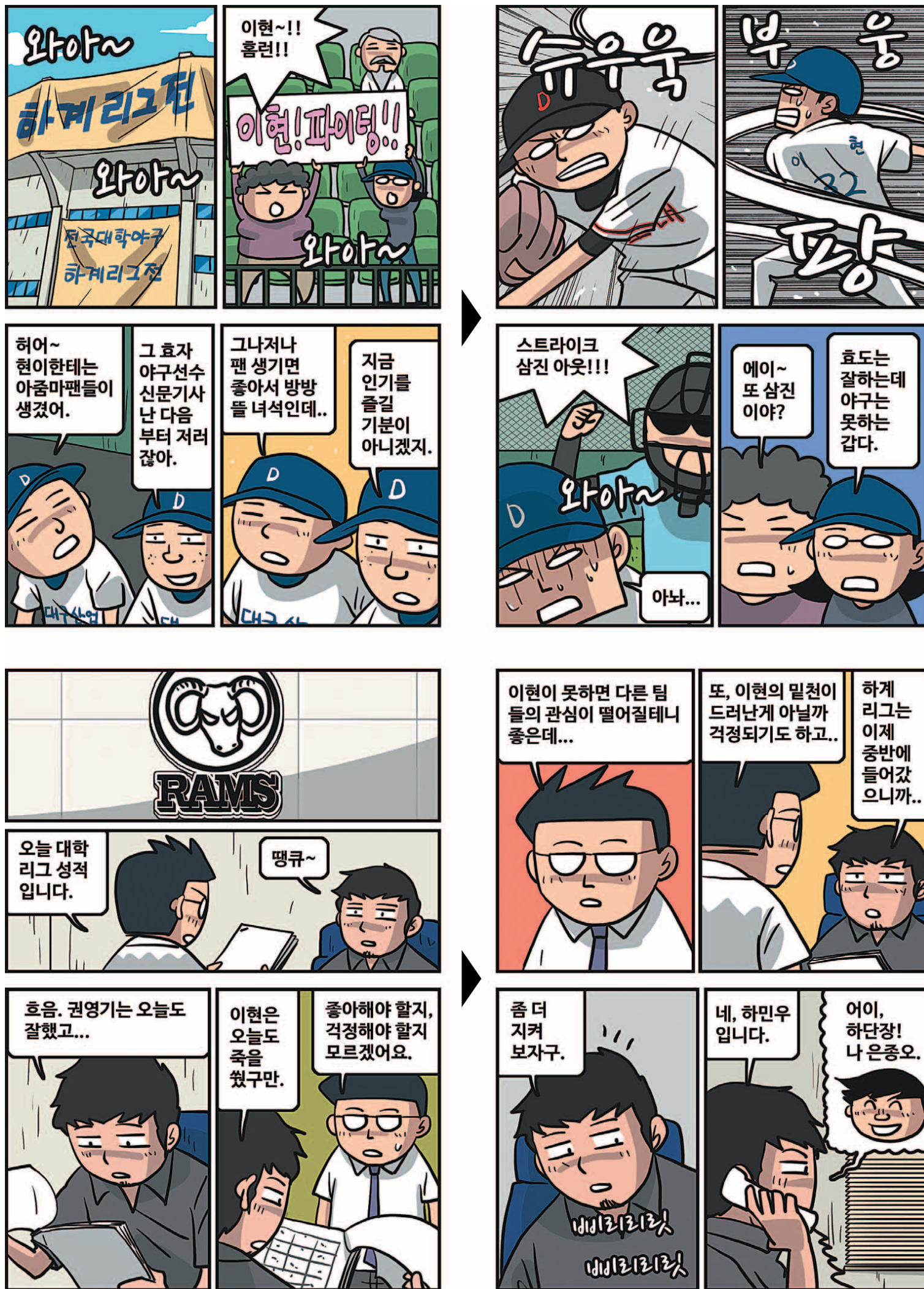
* 'GM 드래프트의 날'은 'sportsdonga.com' 에서 첫 회부터 보실 수 있습니다.