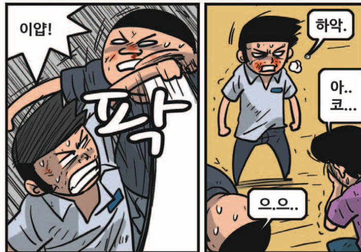
* 'GM 드래프트의 날'은 'sportsdonga.com'에서 첫 회부터 보실 수 있습니다.