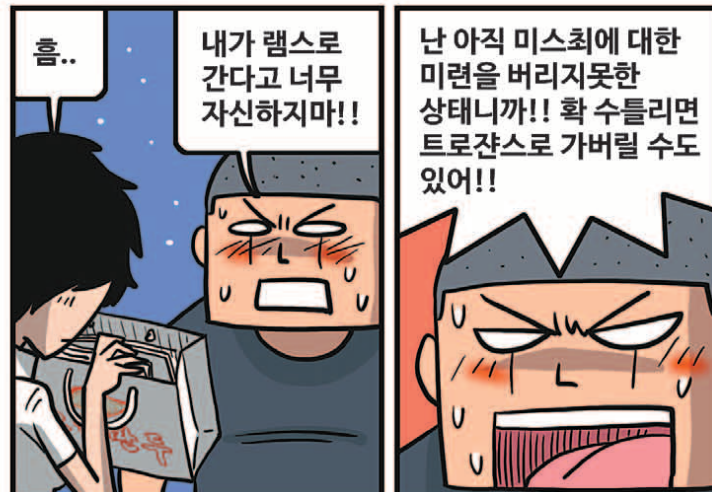
* 'GM 드래프트의 날'은 'sportsdonga.com'에서 첫 회부터 보실 수 있습니다.