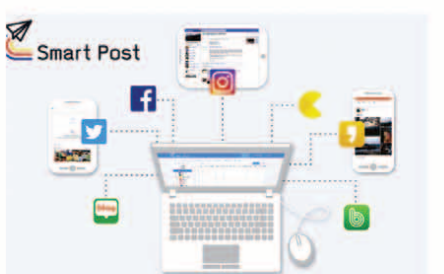
SNS관리 자동화 툴, 스마트 포스트