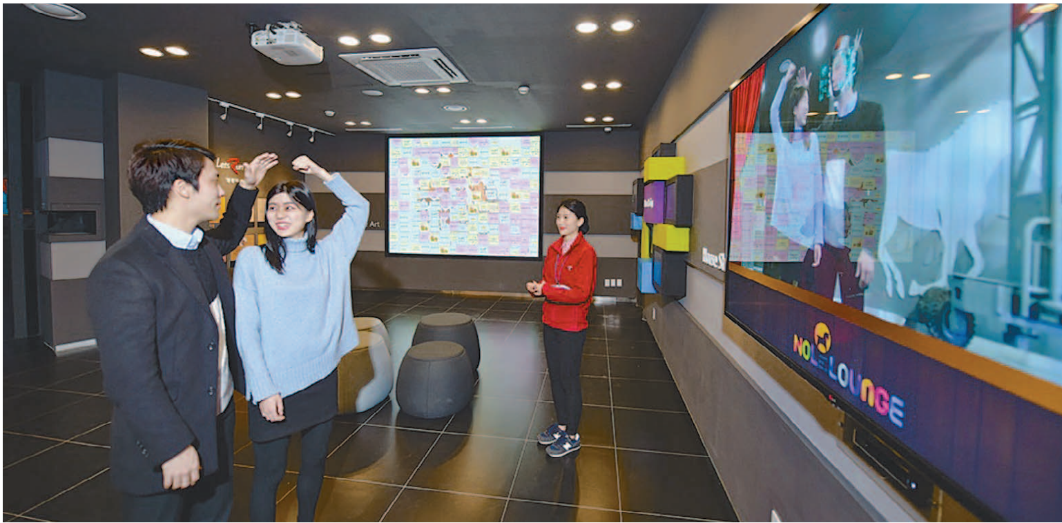
롯데런파크 서울이 2030세대를 겨냥해 만든 '놀라운지'에서 한 젊은 커플이 홀스 컨셉존에서 인터랙티브 스크린을 즐기고 있다. 롯데런파크 서울은 '젊은 피'와 '모바일'이라는 키워드를 앞세워 칼라풀하고 발랄하게 분위기를 바꾸고, 모바일 배팅 활성화를 통해 건전 경마를 이끈다.