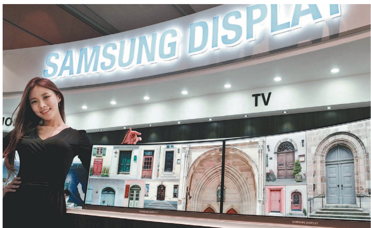
모델이 26일 서울 코엑스에서 열린 '국제정보디스플레이전시회 IMID 2016'에서 디스플레이에 바이오 기술을 접목한 삼성디스플레이의 새로운 디스플레이 기술 제품들을 소개하고 있다. 삼성 디스플레이는 이날 스마트TV 등의 디스플레이에서 나오는 블루라이트를 혁신적으로 감소시키는 기술도 공개했다.