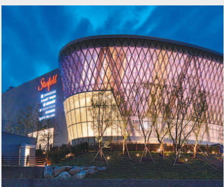
개장 140일 만에 누적방문객수 1000만명을 넘어선 스타필드 하남은 각종 재미있는 기록들을 쏟아냈다. 오픈 후 총 200만대의 차량이 주차했으며, 식음서비스 공간에서는 매일 2만인분의 음식이 만들어졌다. 사진은 스타필드 하남 외부전경.

신세계는 지난해 9월9일 문을 연 스타필드 하남의 누적방문객수가 140일 만인 지난 달 26일 1000만명을 넘어섰다고 14일 밝혔다. 일 평균 방문객수는 7만1000명으로 연간으로 환산했을 경우 대한민국 인구의 절반인 2600만명 이상이 방문할 것으로 예상된다. 이는 아시아에서 가장 많이 방문하는 테마파크인 도쿄 디즈니랜드(연간 1600만명)보다 1000만명 이상 많은 수치라는 게 신세계측의 설명이다. 지난 2015년 오픈했던 이마트타운의 경우 1년 동안 1200만명이 방문한 바 있다.