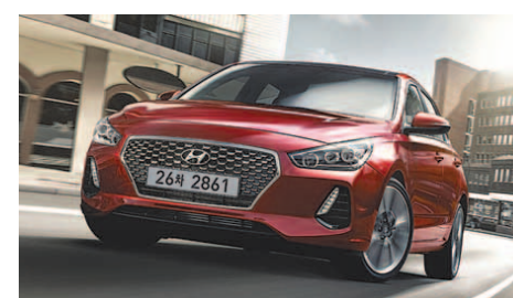
현대차 신형 i30

이번 아우토빌트지 비교 평가는 현대차 신형 i30, 오펜 아스트라, 마쯔다 3, 르노 메간, 푸조 308 등 5개 차종을 대상으로 차체, 파워트레인, 주행성능, 커넥티비티, 친환경성, 편의성, 경제성 등 7개 항목에 걸쳐 진행됐다. 신형 i30는 총점 750점 만점 중 531점을 얻어 1위를 차지했으며, 오펜 아스트라(523점), 마쯔다 3(496점), 르노 메간(490점), 푸조 308(486