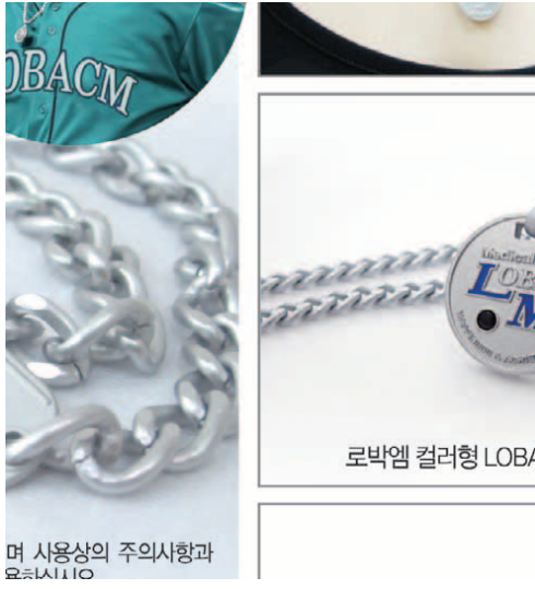
로박엠 컬러형 LOB