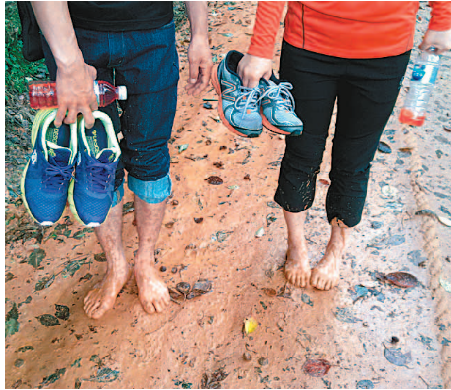
▲대전 대덕구 계곡산 황토길

울창한 삼나무 숲으로 이루어진 절물자연휴양림 안의 자연 휴식길이다. 곳곳에 쉼터가 있어 여유롭게 걷기 좋다. 총 길이 11.1km인데, 부담스럽다면 절물휴양림에서 산책로 일부만 이용할 수 있다.