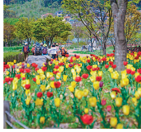
▲백제가요 정음사 오솔길 2코스