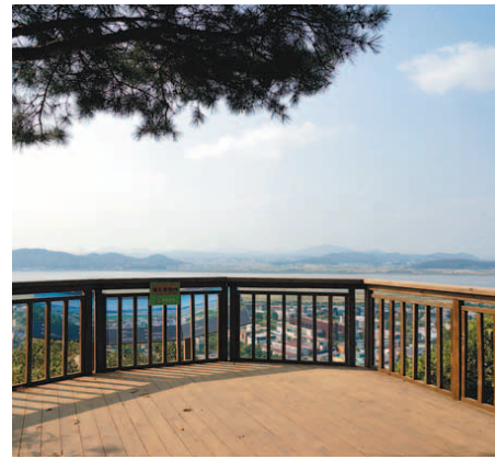
▲경기 파주 심학산 둘레길