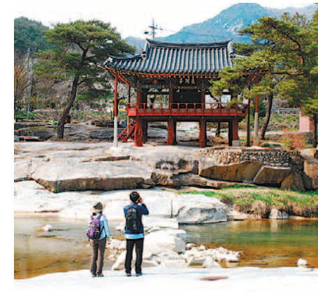
▲경남 함양 선비문화탐방로 1코스