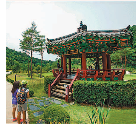
▲강원도 홍천 수타사 산소길