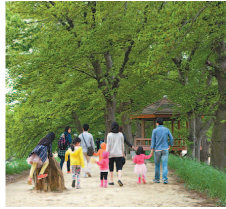
▲전남 담양 담양오방길 1코스 수목길