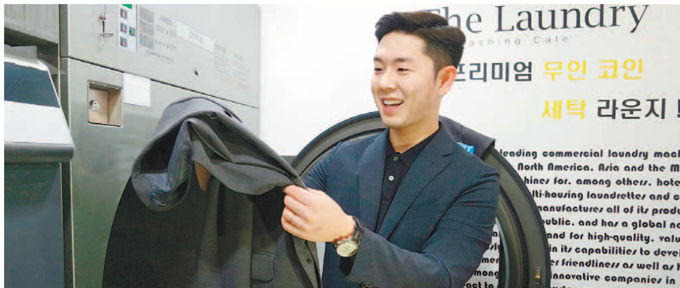
모델이 코오롱FnC 브랜드 '위셔블 슈트'의 물세탁 이후 상태를 확인하고 있다.