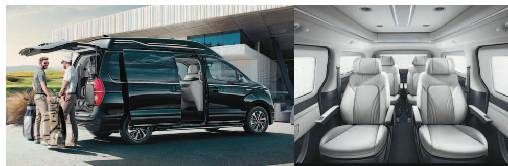
현대차 '더 뉴 그랜드 스타렉스 리무진' (왼쪽)과 6인승 내부 모습.

스타렉스 리무진은 리무진 전용 서스펜션을 새로 도입하고 루프와 바닥 등에 흡차음제를 확대 적용해 승차감과 정숙성을 개선했다. 실내 승객공간은 밝은