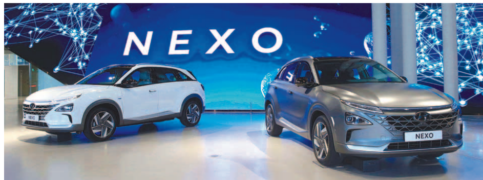
현대자동차가 차세대 수소전기차로 공개한 넥쏘(NEXO). 정부는 민관 합동으로 수소차 시장 선점을 위해 2022년까지 2조6000억원을 투자해 3800개의 일자리를 창출하기로 했다. 이 기간 수소차를 1만 6000대 보급하고, 수소충전소를 310기 설치하겠다는 목표다.

차량 생산·충전소 등 조기 구축 2022년까지 1만6000대 보급 목표 전국 5개 도시 수소버스 투입 예정