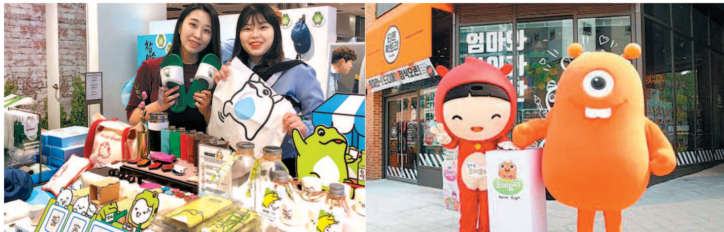
유통업체와 식음료·주류 업계의 협업이 주목받고 있다. 현대백화점 판교점에 선보인 ‘참이슬 팝업스토어’(왼쪽)와 티몬과 매일유업 ‘요미요미’ 캐릭터가 함께 한 특별 프로모션.

유통업체와 식음료·주류 업계가 협업한 이색 체험형 공간이 주목받고 있다. 주로 팝업스토어(임시매장) 형태로 진행 중으로, 기존 매장에서 벗어나 새로운 공간으로 소비자 접점을 늘려 브랜드에 대한 차별화된 체험을 통해 경쟁력을 확보하려는 움직임이다. 현대백화점은 하이트진로와 ‘참이슬 팝업스토어’를 운영 중이다. 지난달부터 판교점, 목동점에서 순차적으로 선보였으며 28일까지 중동점에서, 29일부터 7월5일까지 대구점에서 선보인다. 참이슬 콘텐츠와 패션업체가 협업한 한정판 상품들을 선보인다. 신진 아티스트 8명이 디자인한 소주병도 전시된다. 현대백화점은 지난해 말 오리온과 손잡고 판교점 지하 1층에 ‘초코파이 하우스’를 선보