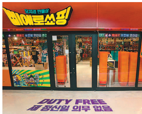
28일 스타필드 코엑스몰에 오픈하는 빼어로 쏘핑 1호점 전경.

식품, 가전제품, 천냥코너, 명품코너 등 4만 여가지에 이른다. 특히 기존 대형 유통업체에서 다루지 않는 성인용품, 코스프레 용 가발·복장, 파이프 담배, 흡연 액세서리 등의 상품도 만날 수 있다. 이마트 측은 “유통채널의 중심이 온라인으로 이동하는 시대에 오프라인 유통채널이 나아가야 할 방향은 재미와 즐거움이라고 판단했다”며 “온라인 시대에 기계이 시간을 내 소비하고 싶은 대상으로 만드는 게 목표”라고 했다. 정정록 기자