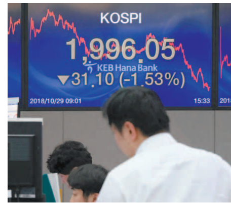
“2000이 무너졌다.” 22개월 만에 2000선이 무너진 코스피 지수를 표시한 KEB하나은행 딜링룸의 주가 현황판. 10월 들어 하락세를 기록하고 있는 국내 증시는 지난 주말을 앞두고 발생한 미국 증시의 하락 여파가 고스란히 더해져 29일 지수가 1996.05까지 후퇴하며 장을 마감했다.