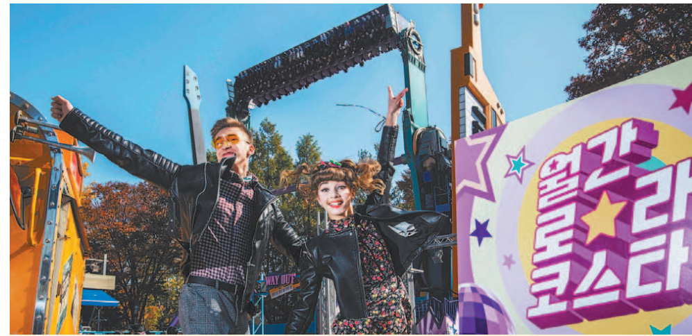
“가을 옛 추억 속으로 풍덩” 에버랜드가 뉴트로 스타일의 새로운 어트랙션 페스티벌 ‘월간 로라코스타’ 축제를 11월 1일부터 진행한다. 뉴트로(new-tro)는 복고(retro)를 새롭게(new) 즐긴다는 뜻이다. 에버랜드는 12월 2일까지 락스빌 지역을 1960~70년대 레트로 테마존으로 바꾸고 어트랙션을 특별하게 즐길 수 있는 이벤트를 풍성하게 마련했다.