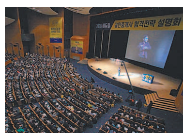
시험을 대비하기 위한 특급 전략을 설명회를 통해 발표하겠다는 방침이다. 11월 4일 삼성동 코엑스에서 설명회를 개최해 공인중개사 전문 교수진과 합격 연구소장의 강연으로 진행될 예정이다. 1부에서는 유망자격증 공인중개사에 대한 전망과 시험 출제 경향 분석을 공개하며, 2부에서는 최다 합격자 배출에 빛나는 에듀월만의 합격 노하우를 공개할 예정이다. 마지막 3부에서는 교수 간담회 및 전문 학습상담, 경품 추첨 등의 이벤트가 진행된다.

공법 난이도 또한 중상으로 건축법·주택법·농지법 부문에 지엽적인 문제가 출제된 것이 특징적이었다. 공시법의 경우 난이도 중상으로 지적법은 다소 평이한 수준이었으나 등기법이 까다로웠다고 전했다. 마지막