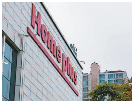
일방적으로 임대 매장 위치를 변경하면서 면적을 줄이고 임차인에게 인테리어 비용까지 떠넘겼다가 공정거래위원회에 적발된 홈플러스.

계약기간 남았는데 이전·축소 신규 인테리어 비용마저 전가 공정위 과징금 4500만 원 부과