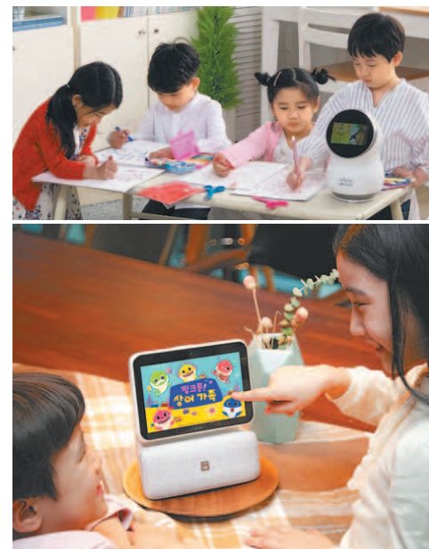
새로 출시한 인공지능(AI) 기기들이 어린이들을 위한 '키즈 콘텐츠'를 핵심 경쟁력으로 내세우고 있다. 16일부터 판매하는 LG전자의 홈로봇 'LG 클로이' (위)와 SK텔레콤이 4월 출시한 '누구 네모'.

SK텔레콤이 4월 출시한 '누구 네모'는 학습 도우미 역할이 강점이다. 핑크퐁 놀이학습 5종과 옥수수 키즈 주분형비디오(VoD) 콘텐츠를 무료 제공한다. '거꾸로 가위바위보' 등 게임을 통해 지각능력과 순발력, 응용능력 등을 키울 수 있는 영상 인식 기반 학습게임도 개발해 서비스한다. 영상을 보던 아이가 화면 가까이 올 경우, 적절한 거리에서 시청하도록 영상을 자동으로 멈추고 '뒤로 가기' 안내를 하는 기능도 갖췄다. 김명근 기자