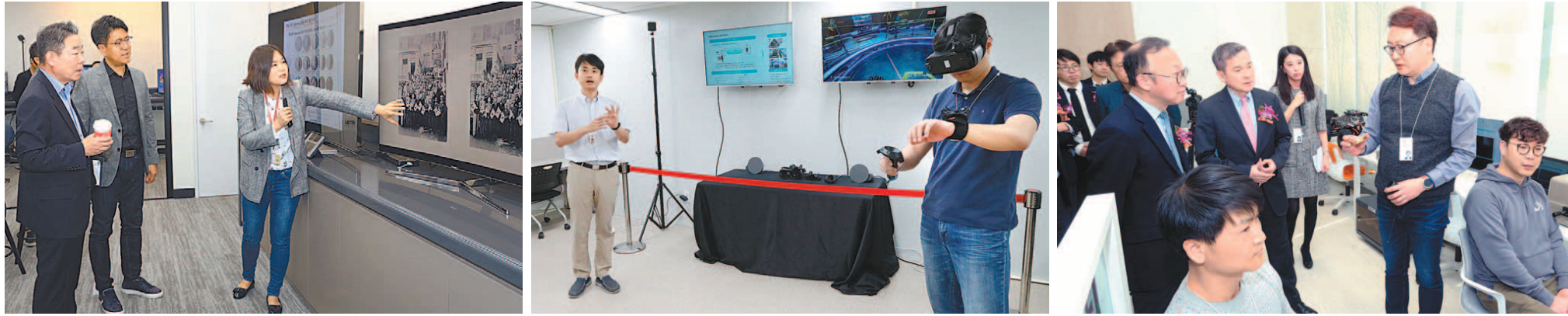
이동통신 기업들이 다양한 협업 공간 마련을 통해 5G 기반 스타트업 및 중소기업 육성에 적극 나서고 있다. SK텔레콤의 최신 ICT 기술 협업 공간인 '테크갤러리', KT의 5G 서비스 개발 협업 공간 '5G 오픈 랩', LG유플러스의 5G 서비스 개발 협업 공간 '5G 이노베이션 랩' (왼쪽부터).