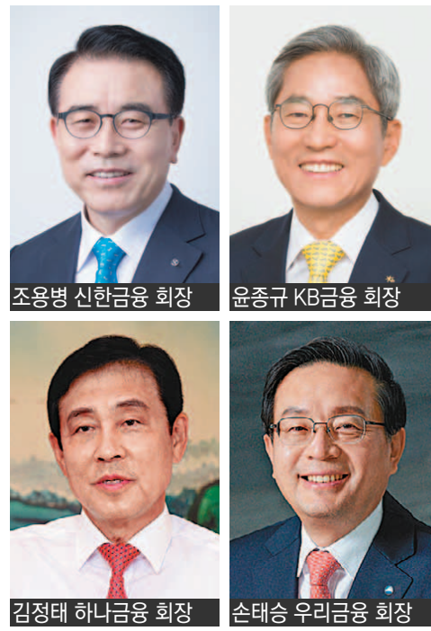
조용병 신한금융 회장