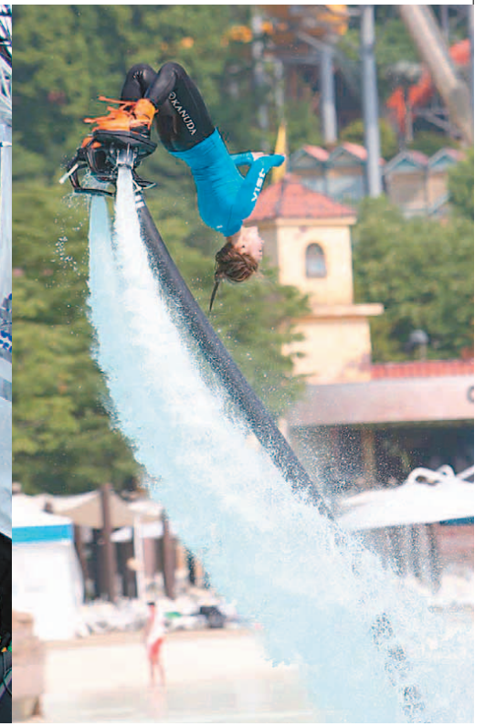
여름 워터파크의 매력은 색다른 체험과 재미를 느낄 수 있는 다양한 놀거려다. 한여름 무더위를 잊게 만드는 신나는 비트의 다양한 음악을 즐기는 캐리비안 베이 '메가 폴파티'(왼쪽)와 제트 엔진으로 시원한 물줄기를 뿜으며 최고 20m까지 올라가는 플라이보드의 묘기를 즐길 수 있는 야외파도풀의 '플라이보드쇼'.