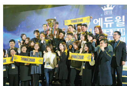
에듀윌 공인중개사 지식인 '에지인' 오픈

그렇다면 교육기관은 어떤 곳을 선택해야 할까. 종합교육기업 에듀윌은 '합격자 수'를 확인하는 것을 추천했다.