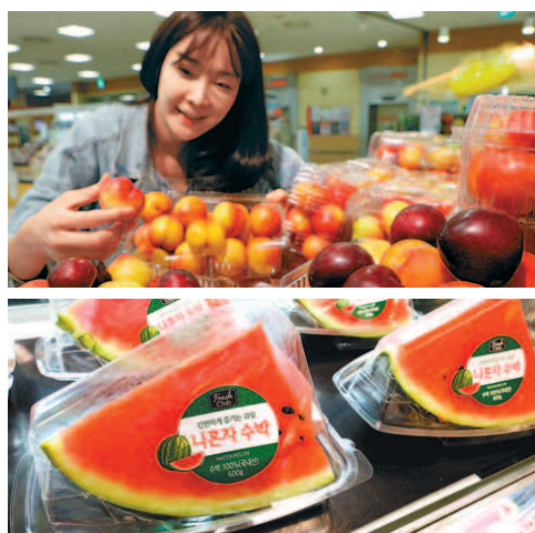
롯데마트의 '자두 페스티벌'(위)과 이마트의 '나혼자 수박'.

이마트에서는 소포장 수박인 '나혼자 수박'의 6월 매출이 전년보다 87%나 증가했다. 나혼자 수박은 1팩에 600g 내외의 소포장으로 수박을 먹고 싶지만 한 통을 사기는 부담스러운 1인 가구를 겨냥한 기획 상품이다. 1인 가구가 수박 한 통을 한 번에 다 먹기 힘들다는 특성을 고려해 과일