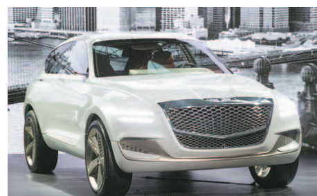
제네시스 브랜드는 2017년 뉴욕 국제 오토쇼에서 수소연료전지 SUV 콘셉트카인 GV80 콘셉트'를 세계 최초로 공개한 바 있다. 이후 실제 양산차로 나오게 될 GV80 디자인은 여전히 베일에 가려져 있다.

쉐보레 역시 9월 정통 대형 SUV 트래버스를 출시하고 본격적인 시장 확대에 나설 예정이다. 동급 최대 차체(전장 51