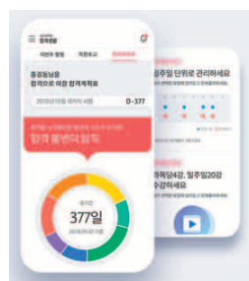
리플렛을 제공해주기 때문에 합격에 중요한 '학습 관리'를 손쉽게 할 수 있는 점이 특징이다.

셋째는 바로 꾸준한 영단어 암기다. 영단어 암기에 소홀하면 정해진 영어점수를 올리는 데 시간을 허비할 수 있다. 이동시간 등의 자투리 시간을 활용해 영단어를 암기한 것을 합격의 비법으로 꼽는 합격생이 많았다. 마지막은 규칙적인 생활패턴이다. 스트레스와 체력관리 등 자기관리는 필수적이라는 것.