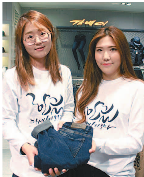
잡뱅이의 '한글 다시 날아오르다 티셔츠', TBJ의 한글 배지, 이랜드 오에스티의 '언제나 기억해' 무궁화 한정판 패키지(왼쪽부터 시계방향). 10월 9일 한글날을 맞아 패션업계의 '한글 마케팅'이 한창이다.

이랜드 주얼리 브랜드 오에스티는 '언제나 기억해' 무궁화 한정판 패키지를 선보였다. 무궁화 모양의 카드 지갑, 한