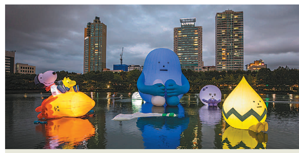
"석촌호수에서 귀여운 스누피와 우주괴물을 만나세요" 롯데물산은 서울 석촌호수 동호 및 주변 공간에서 27일까지 스티키콘스터랩과 함께하는 공공미술 '루나 프로젝트'를 진행한다. 달 착륙 50주년을 기념해 인류의 꿈과 도전, 스누피의 사랑 메시지를 우주 몬스터의 귀여운 모습을 통해 보여주는 이벤트다. 우주 몬스터는 최대 16m의 초대형 별문 등 7개로 만들었고, 스누피는 롯데케미칼과 한국심유개발연구원의 공동연구로 탄생한 재활용 플라스틱 섬유 (Recycled PET)로 제작했다. 김재범 기자