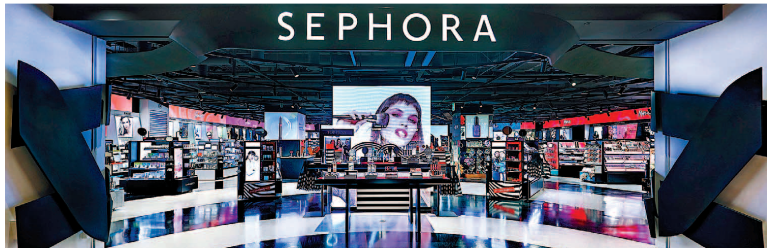
뷰티 편집숍 부문 글로벌 1위 브랜드 세포라가 한국에 진출했다. 24일 문을 여는 한국 1호점 서울 삼성동 파르나스몰점.