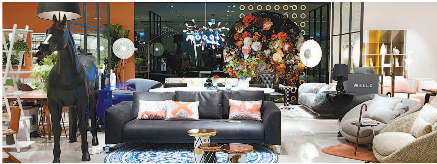
최근 리뉴얼 한 현대백화점 무역센터점의 럭셔리 리빙관. 백화점 업계가 효자 역할을 하고 있는 리빙관 강화에 열을 올리고 있다.

이런 소비 흐름에 맞춰 백화점마다 리빙관에 대한 공격적인 영업전략을 펼치고 있다. 롯데백화점은 서울 소공동 본점의 리빙 분야를 대대적으로 리뉴얼했