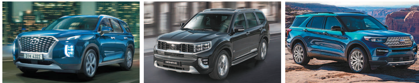
연이신 차 출시로 하반기 대형 SUV 시장이 달아오르고 있다. (위부터 시계방향으로)아메리칸 대형 SUV의 원조격인 쉐보레 트레버스, 글로벌 스테디셀러 포드 올 뉴 익스플로러, 페이스리프트 모델인 기아차 모하비 더 마스터, 자동차전문기자협회 선정 '2019 올해의 차' 현대차 팰리세이드.

'올해의 차' 팰리세이드, 인기 여전 트레버스, 견인 기능 앞세워 차별화 풀체인지급 변화 모하비...상품성 ↑ 익스플로러, 진화한 주행능력 눈길