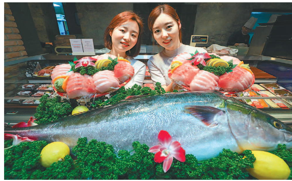
“제철 맞은 대방어, 저렴히 구입하세요” 13일 현대백화점 압구정점 식품관에서 직원들이 12kg 이상의 자연산 대방어와 방어회를 선보이고 있다. 현대백화점은 15일부터 17일까지 경인지역 10개 점포의 식품관에서 동해안과 제주도에서 어획한 자연산 대방어를 30% 할인 판매한다. 정정욱 기자, 사진제공 | 현대백화점

올해 유니크 베뉴 30선 중 새로 선정된 곳은 자동차 서킷 드라이브 체험을 할 수 있는 강원 '인제스피디움', 전주 한옥숙박업소인 '왕의지밀', 세계적인 건축가 안도 다다오가 설계한 제주 '본태박물관', 젊은 이들의 핫플레이스로 주목받는 인천 복합문화공간 '코스모40' 등을 포함해 19개이다. 김재범 기자 oldfield@donga.com