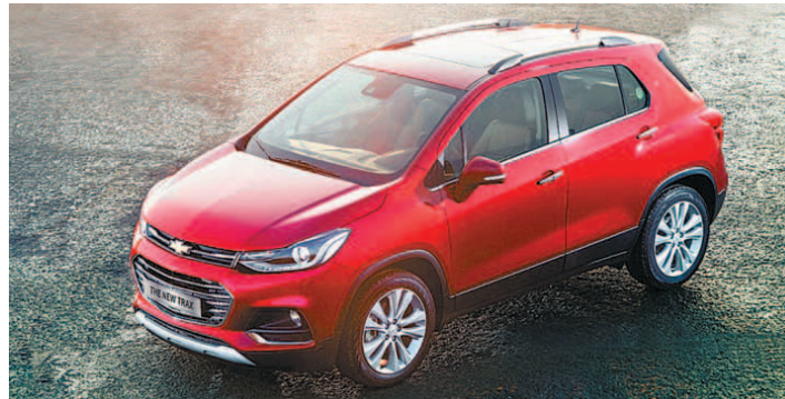
쉐보레의 경차 스파크, 소형SUV 트랙스, 중형세단 더 뉴 말리부(위쪽 사진부터 시계방향). 이들 세 차종이 올해 1~10월 쉐보레 국내 판매의 80.8%를 차지하는 등 쉐보레 브랜드의 중심 축으로 자리매김 하고 있다.

터보엔진 탑재·기본기 탄탄 말리부 '착한가격' 트랙스, 펀드라이빙 실현 안전성 갖춘 스파크, 고객만족도 1위 올해 브랜드 전체판매량 80% 차지