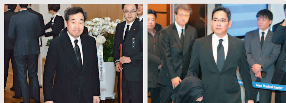
이낙연 전 국무총리(왼쪽)와 이재용 삼성전자 부회장이 20일 서울 송파구 서울아산병원에 마련된 신격호 롯데그룹 명예회장의 빈소를 찾아 조문했다. 뉴스스

한국경영자총협회와 전국경제인연합회, 대한상공회의소, 중소기업중앙회 등 경제단체들은 19일 신격호 회장의 타계와 관련해 "고인이 롯데그룹을 성장시키며 보여준 열정과 도전정신은 지금까지