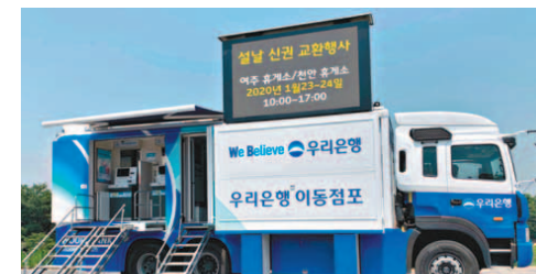
우리은행의 버스형 이동식 점포.

귀중품 보관 서비스도 있다. NH농협은행은 29일까지 대여금고가 있는 194개 영업점에서 현금, 유가증권, 귀중품 등을 무료로 보관해주는 안심서비스를 진행한다. 해외여행을 떠나는 고객을 위한 환전 이벤트도 실시한다. KEB하나은행은 2월 29일까지 '겨울여행 환전 종합선물 세트' 이벤트를 통해 미화 500달러 상당액 이상 환전하