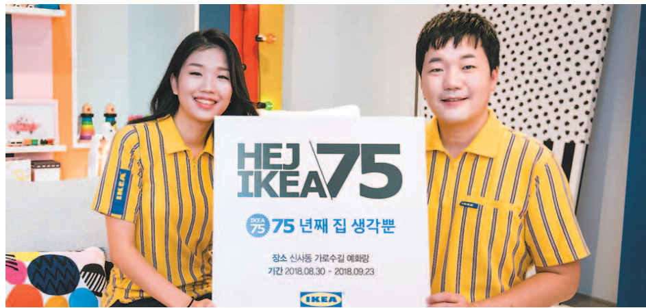
이케아 모델들이 'HEJ IKEA 75' 팝업 전시를 소개하고 있는 모습. 이케아가 이커머스에 진출하면서 9월부터 국내 가구 및 홈퍼니싱 업체와의 온라인·모바일에서 정면대결이 불가피해졌다.

안드레 슈미트갈 대표는 29일 서울 가로수길 예화랑에서 기자회견을 열고 "현재 시범운영 중인 온라인 판매를 9월1일부터 공식 론칭한다"며 "한국에 이케아 매장이 두 곳 밖에 없다는 점을 감안해 더 많은 고객이 이케아 제품을 접할 수 있도록 온라인