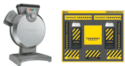
▲쿠진아트 와플기 ▲안전담은 감사세트

추석이 20여 일 앞으로 다가왔다. 설과 함께 우리의 2대 전통 명절이고, 햇곡식과 햇과일을 맛볼 수 있는 제철이다 보니 매년 유통업계에게는 소홀히 할 수 없는 대목이다. 올해도 어김없이 백화점부터 마트 편의점까지 추석 선물세트를 내놓았다. 올해 추석 선물의 특징은 1인 가족과 소확행, 그리고 반려동물이다. 나홀로 가정을 겨냥해 소포장 선물세트가 크게 늘었고, 소확행(작지만 확실한 행복), 펫팜족(반려동물을 가족으로 여기는 사람들), 안전과 재활용 등의 테마로 상품 차별화에 나섰다.