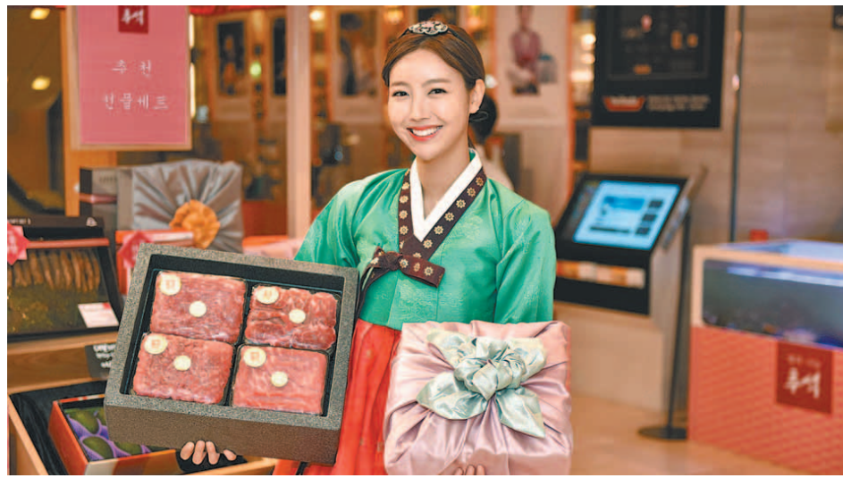
1인 가구를 겨냥한 롯데백화점 추석 정육선물세트.