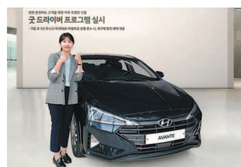
3년 간 준법·안전 운전을 실천한 고객을 대상으로 차량 재구매 시 할인 혜택을 제공하는 현대자동차의 '굿 드라이버 프로그램'.

현대자동차 관계자는 "앞으로도 준법의식이 높고 안전운전을 준수하는 고객분들을 위한 다양한 프로그램을 지속적으로 마