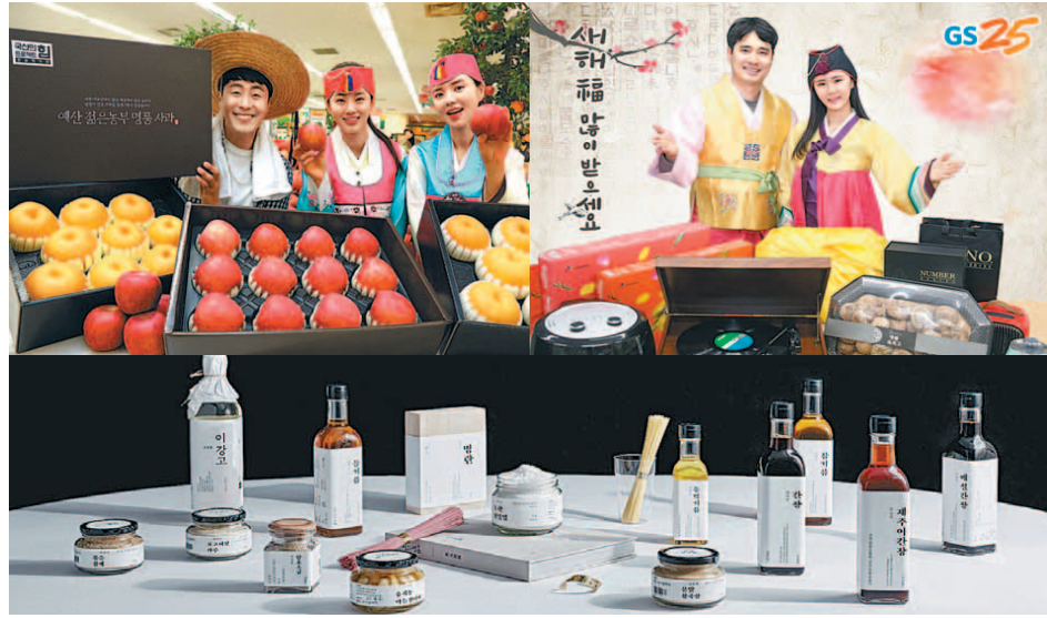
이마트의 스토리텔링 과일 선물세트, 클래식 오디오 턴테이블을 포함한 GS25의 설 선물 세트, 현대백화점의 명인명촌 세트(왼쪽부터 시계방향), 스토리텔링과 가치소비가 2019 기해년 설 선물 트렌드로 주목받고 있다.

생산자 스토리로 제품 신뢰도 높여 '소확행' '가심비'...이색 제품 출시 클래식 오디오 턴테이블 등 눈길