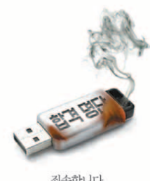
최소합니다. 합격자 수가 너무 많아, 전부 담을 수 없습니다.