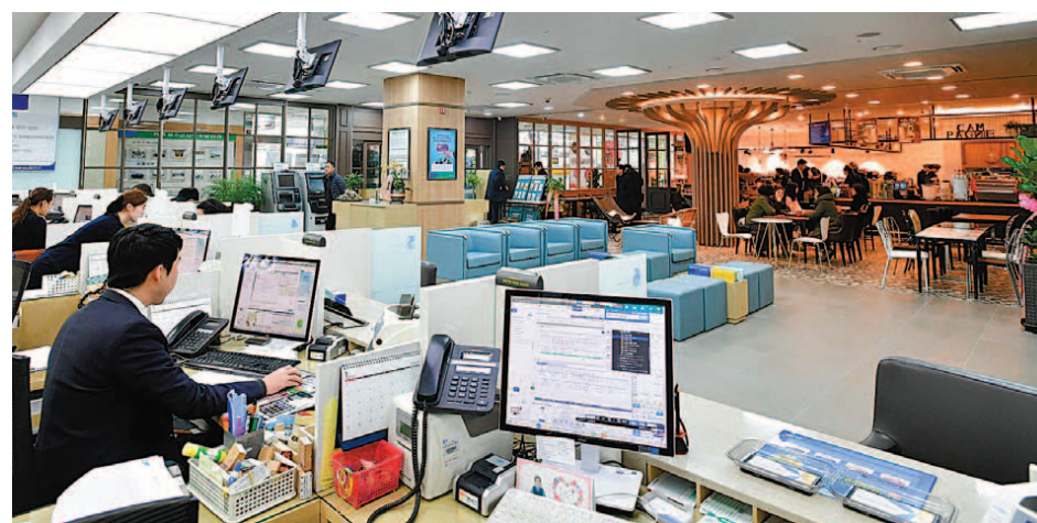
울산 지역의 유명 베이커리인 빵드겸빠뉴 매장과 은행 영업점을 결합한 NH농협은행의 특화점포 ‘빵킹 위드 디저트’. 금융업과 산업 연관성이 높지 않은 이종 업종과의 파격적인 협업으로 새로운 비즈니스 모델을 개발하려는 금융권의 움직임이 요즘 활발하다.

은행 영업점에 다른 업종을 도입한 특화점포는 이제 대부분의 시중은행들이 경쟁적으로 실시하고 있다. NH농협은행은 울산 지역의 유명 베이커리인 빵드 겸빠뉴 매장과 영업점을 결합한 ‘빵킹 위드 디저트’ 특화점포를 문수로에서 운영하고 있다. 또한 고양시에서는 편의점을 결합한 특화점포 ‘하나로미니 인 브랜치’도 영업 중이다. 편의점에서 파는 기존 상품과 함께 주요 농산물과 농가공식품을 살 수 있는 점포로 자동출입금기 공간인 365코너도 연결했다. 우리은행 역시