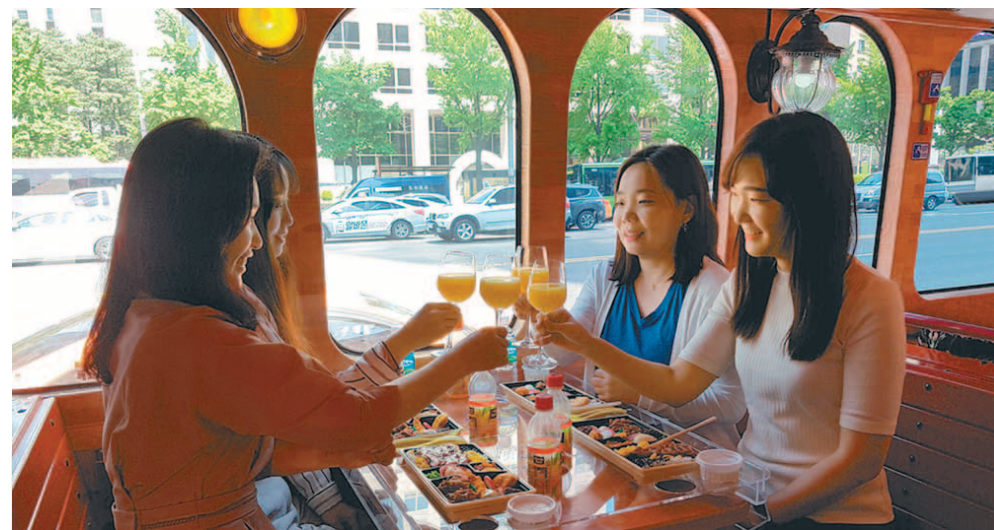
"시티투어 버스에서 즐기는 만찬" 서울시티투어버스는 국내 최초로 도심 관광과 식사를 동시에 즐길 수 있는 '버스트랑' 서비스를 내놓았다. 투어버스 안에서 가이드의 설명과 함께 도시를 관광하고 세빛섬에서 한강의 멋진 풍경과 함께 식사를 즐길 수 있다. 새로운 서울 도심 관광 프로그램인 '버스트랑' 시간의 데이백과 야경을 볼 수 있는 나이트백 두 가지로 운영한다. 김재범 기자·사진제공 | 서울시티투어버스

서울시 C-ITS 실증사업 주관사업자인 SK텔레콤은 상암 지역에 5G 인프라 구축과 HD맵 제작 및 적용, 5G·AI 기반 보행자·교차로 모니터링 시스템 등을 구축 완료했다. 김명근 기자 dionys@donga.com