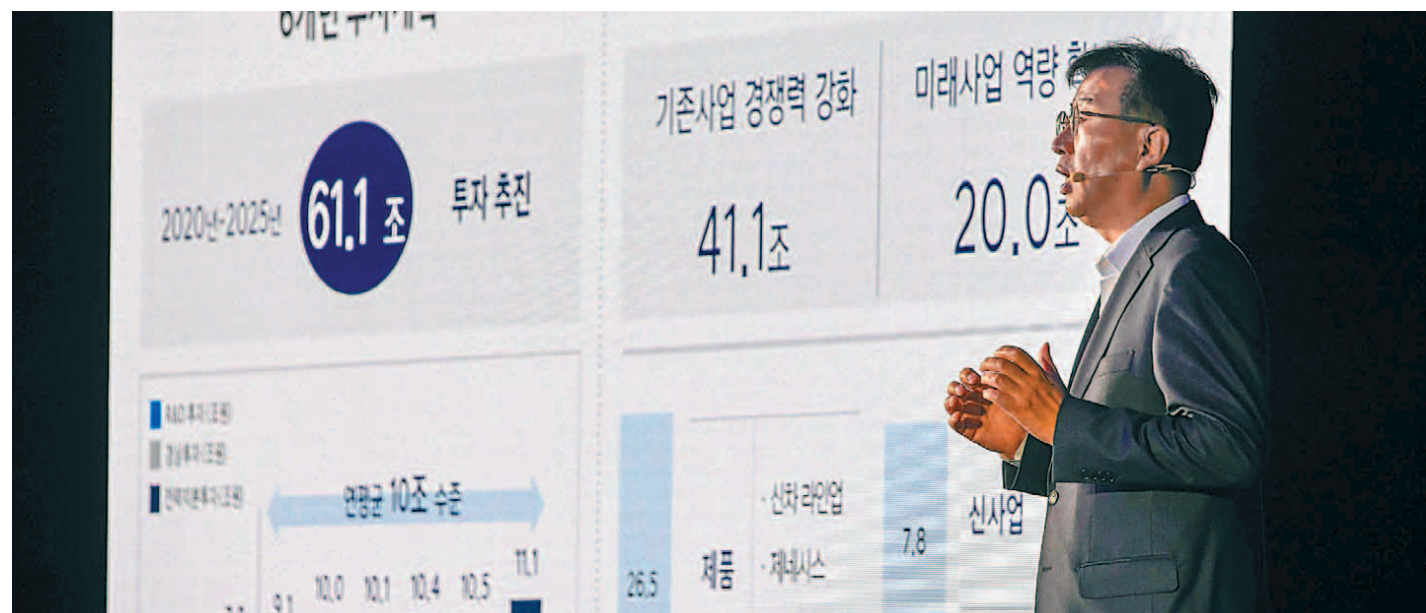
이원희 현대자동차 사장이 4일 열린 'CEO 인베스터 데이'에 참석해 2020년부터 2025년까지 6년간 총 61조1000억 원을 투자하는 중장기 계획 '2025 전략'을 발표하고 있다.

내연기관 차량에서 수익성을 확보해 미래 전동화 시대 대응을 강화하고, 자동차는 물론 PAV, 로보틱스, 라스트마일 모빌리티 등 다양한 모빌리티 제품을 통해 끊임 없는 이동 경험을 제공할 계