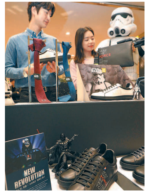
“스타워즈 마니아 모여라!” 롯데백화점 본점이 15일까지 지하1층에서 2020년 1월 개봉하는 영화 ‘스타워즈: 라이즈 오브 스카이 워커’의 캐릭터와 로고가 들어간 의류, 가방, 신발, 피규어 등 다양한 굿즈를 판매한다. 개인 SNS에 스타워즈 컬렉션 인증 고객 중 추첨을 통해 스타워즈 영화 예매권(1인 2매)을 증정한다. 정정욱 기자

2025년 글로벌 시장 점유율 목표는 2018년 대비 약 1%포인트 증가한 5%대로 잡았다. 권역별 시장 수요 변화에 유연히 대응하며 경쟁력 있는 모빌리티 사업을 진행해 점유율 목표치를 달성한다는 전략이다. 원성열 기자 sereno@donga.com