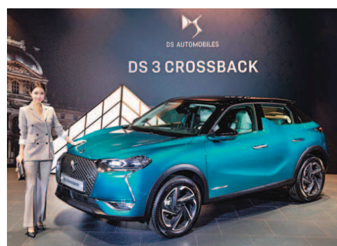
프리미엄 컴팩트 SUV 'DS 3 크로스백'.

DS오토모빌(이하 DS)이 프리미엄 컴팩트 SUV 'DS 3 크로스백'을 10일 공식 출시했다. 올 초 화제를 모았던 플래그십 SUV 'DS 7 크로스백'에 이어 DS가 국내에 선보인 두 번째 모델이다. 엔트리급인 B세그먼트에 속하는 소형 SUV지만 브랜드 특유의 프랑스 명품 감성을 담은 정교한 디테일과 첨단 기술이 돋보인다. 전면부 디자인에서 가장 눈길을 끄는 것은 DS 매트릭스LED 비전 라이트와 펄 스티치가 돋보이는 주간주행등이다. 그릴 디자인과 잘 어울려 DS 3 크로스백만의 감