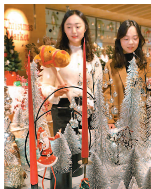
"크리스마스 마켓"으로 오세요" 롯데백화점이 26일까지 서울 소공동 본점 8층에서 '크리스마스 마켓 팝업스토어'를 운영한다. 크리스마스 분위기에 맞는 북유럽 스타일의 홈데코 상품, 산타 인형, 가구 등을 판매한다. 고객이 직접 트리와 장식품을 선택해 나만의 크리스마스 트리를 만들 수 있는 이벤트도 마련했다. 정정욱 기자

위기를 완성했다. 15가지 첨단 안전사양을 전 트림에 기본 적용했다. 3개 LED 모듈과 15개 독립적인 LED 모듈이 주행조건 및 도로상황에 따라 밝기와 각도를 조절하는 DS 매트릭스 LED 비전 라이트, 레벨2 자율주행기술인 DS 드라이브 어시스트, 첨단 레이더로 차량을 비롯해 자전거와 사람까지 인식하는 3세대 액티브 세이프티 브레이크 등을 동급 최초로 적용했다. 1.5리터 블루HDI 엔진과 8단 자동변속기(EAT8)로 최고출력 131마력, 최대토크 31kg.m를 발휘한다. 국내는 상위 트림만 출시한다. 쏘시크 테크팩 트림 3945만 원, 그랜드시크 트림 4242만 원, 그랜드시크 트림은 4340만 원이다. 원성열 기자 sereno@donga.com