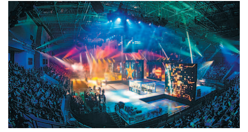
‘CFS 2019’ 성료…빈시트 게이밍 우승

스마일게이트의 ‘크로스피어’를 종목으로 한 글로벌 e스포츠 대회 ‘크로스피어 스타츠(CFS) 2019’(사지)가 브라질의 승리로 막을 내렸다.