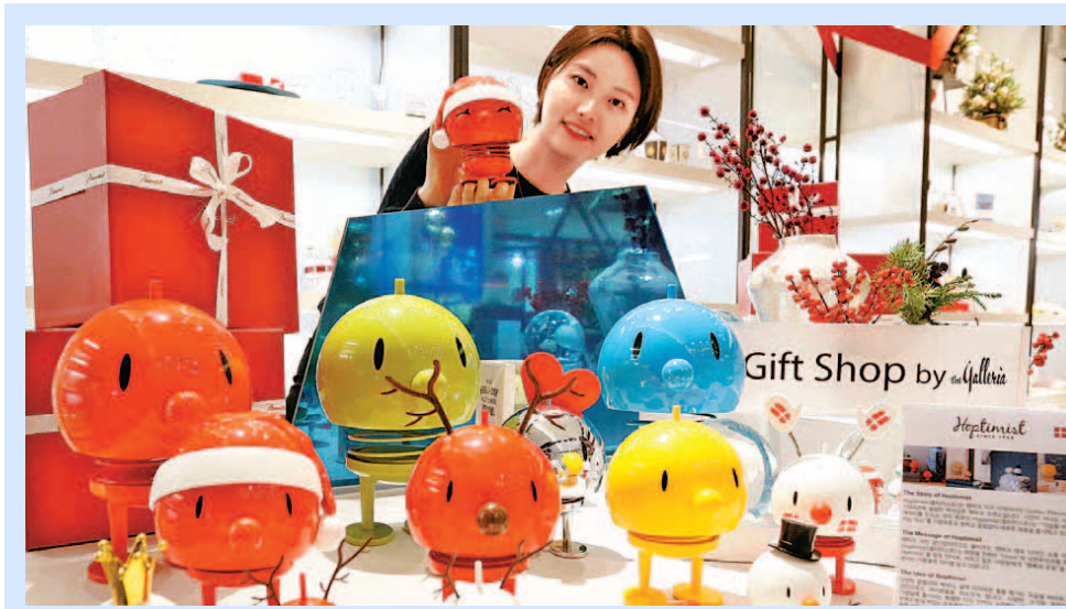
“희망 전하는 옵티미스트 사세요”

서울 압구정 갤러리아명품관이 크리스마스 시즌을 맞아 덴마크의 국민 장난감으로 불리는 ‘옵티미스트’를 선보였다. 희망을 뜻하는 Hope와 낙관주의자를 뜻하는 Optimist를 합친 단어로, 살짝 누르면 통통 튀기는 독특한 모습의 캐릭터 장난감이다.