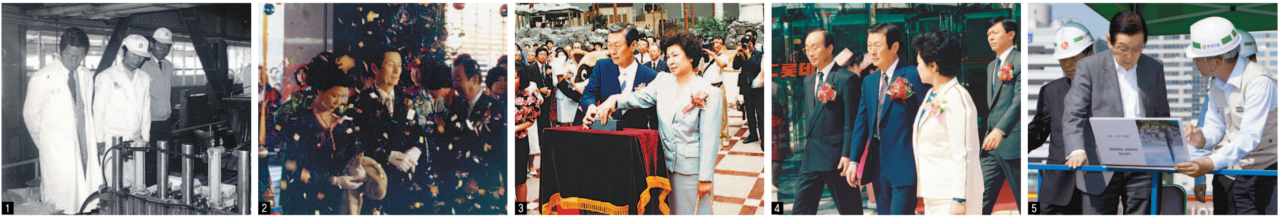
1. 1979년 롯데쇼핑센터 개장 행사에서 테이프 커팅을 하고 있다 2. 1989년 롯데월드 개관을 축하하는 신격호 명예회장 내외 3. 1991년 롯데백화점 영등포점 개점 기념식에 참석한 신격호 명예회장 내외와 신동빈 회장 4. 2011년 롯데월드타워 건설현장을 방문한 신격호 명예회장 5.