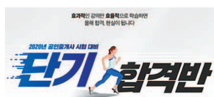
경제적인 부분을 고려해 타사에서 약 45만 원 상당의 기출문제특강을 정규과정으로 포함했다. 이 밖에도 업계 유일, 합격자 수 1위를 만든 압도적인 교수진의 명품 강의를 비롯해 인기 온라인 서점 예스24에서 39개월 연속 베스트셀러 1위를 차지하고 있는 에듀윌 자체 제작 수험서로 학습 효율성을 높였다.

특히 최근 에듀윌은 KRI 한국기록원으로부터 2019년 공인중개사 최다 합격자 배출을 공식 인증받았다. 이는 2016년, 2017년에 이어 세 번째 공식 인증받은 기록으로 업계 ‘초격차’를 실현하며 명실상부 공인중개사 1등 기업임을 스스로 증명하고 있다.