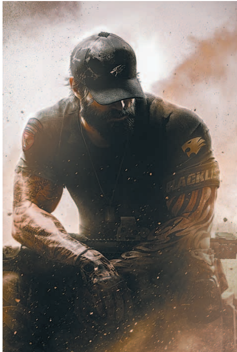
게임 기반 웹툰과 영화 제작 등 게임업계 IP(지적재산권)가 엔터 콘텐츠 시장에서 주목받고 있다. 모바일게임 ‘일진에게 찍혔을 때’ IP를 원작으로 한 웹툰(왼쪽)과 할리우드 영화화가 추진 중인 글로벌 흥행 게임 ‘크로스파이어’.

있는 플랫폼 ‘스토리픽’도 선보일 예정이다. 컴투스는 ‘워킹데드’로 유명한 미국의 스카이바운드 엔터테인먼트에 전략적 투자를 하고 글로벌 IP 비즈니스를 위한 사업 제휴 계약을 체결했다. 스카이바운드와 협업해 애니메이션 등 ‘서머