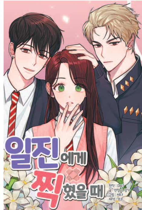
게임 기반 웹툰과 영화 제작 등 게임업계 IP(지적재산권)가 엔터 콘텐츠 시장에서 주목받고 있다. 모바일게임 ‘일진에게 찍혔을 때’ IP를 원작으로 한 웹툰(왼쪽)과 할리우드 영화화가 추진 중인 글로벌 흥행 게임 ‘크로스파이어’.

컴투스는 테이세븐과 콘텐츠 비즈니스 연계 IP 사업을 키우고 있으며, 넷플릭스 오리지널 ‘킹덤’ IP를 활용한 게임을 포함해 다양한 스토리게임을 즐길 수