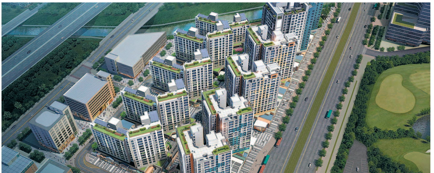
GTX 노선이 지나가는 지역의 신규 아파트 단지가 주목받고 있다. 사진은 '동탄역 헤리엇' 조감도.

GTX 호재로 양주·파주 등에서 그동안 적체됐던 미분양 물량도 해소된 것